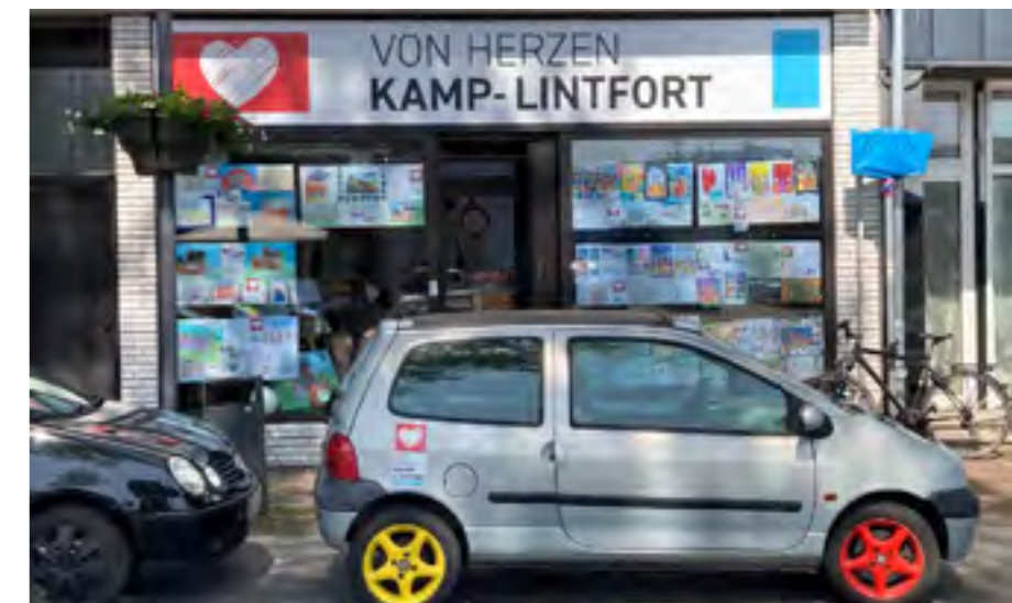
Seit Anfang Juni erstrahlt die Beschilderung auf der Friedrichstr. 7 im neuen Glanz.