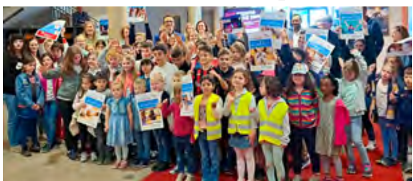
Viel Jubel bei der Preisverleihung in unserem Kino Hall of Fame. Die besten Teams, Schulklassen und Kitas durften sich über tolle Preise freuen.