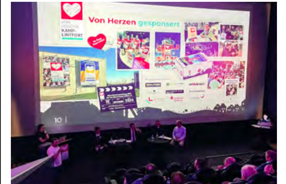
Volles Kino zur Jahreshauptversammlung der Mitglieder

handel, gehören heute gleichermaßen Handwerker, Dienstleister, Kultur- und Fördervereine sowie öffentliche Institution zum Interessennetzwerk für unsere Stadt.