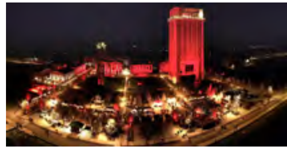
Der Weihnachtsmarkt im Zechenpark von oben.

soires, Dekoration, Floristik über Holzarbeiten, Kerzen, Kunst und allerlei Geschenkartikel, gibt es viel zum Stöbern und Schenken. Auch das gastronomische Angebot lädt zum Verweilen ein: Süßes und Herzhaftes wird an den verschiedenen Rahmenprogramm an. Verschiedene Bands und Orchester bespielen täglich die Bühne. Es werden nicht nur Weihnachtslieder gespielt, sondern auch rockige Klänge zu hören sein. Die genauen Auftrittzeiten werden noch bekannt gegeben.