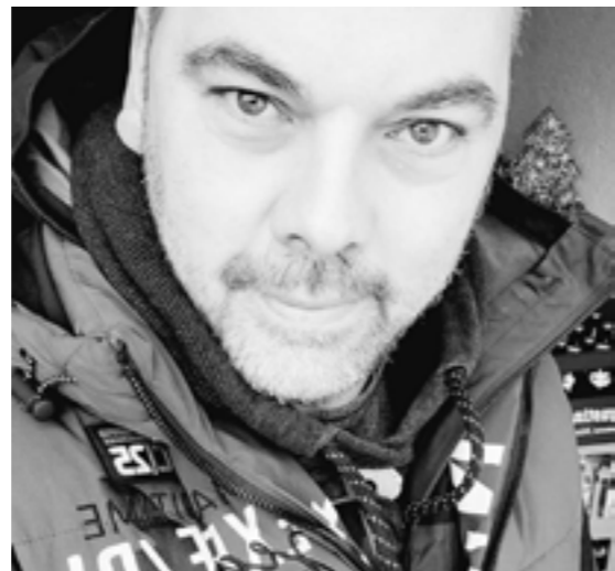
Fotograf Stefan Büschken

einfach mitgerissen hat.“ Mittlerweile wird der 46-Jährige, der im eigentlichen Beruf Geschäftskundenexperte der Telekom ist, immer häufiger angesprochen, wenn es um Bilder für die Stadt geht, was ihn sehr freut. „Mein Hobby hat mich nie losgelassen.“ Daher ist er stets offen für Neues und für potentielle Ideengeber. Inzwischen arbeite er mit einer Manufaktur aus Köln zusammen und kann verschiedene Bildträger mit oder ohne Rahmen anbieten.